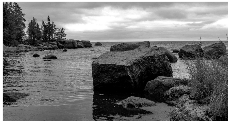
Каменистая тропа, Выборгский район

На сегодняшний день все 47 экологических маршрутов, заявленных в проекте «Тропа47», введены. Далее мы будем поддерживать в рабочем состоянии уже построенную инфраструктуру, создавать комбинированные маршруты, чтобы была возможность на одной территории, в зависимости от уровня подготовки, пройти более длинные расстояния. Для снижения антропогенной нагрузки очень нужны организованные стоянки, информационные щиты и другая полезная инфраструктура.