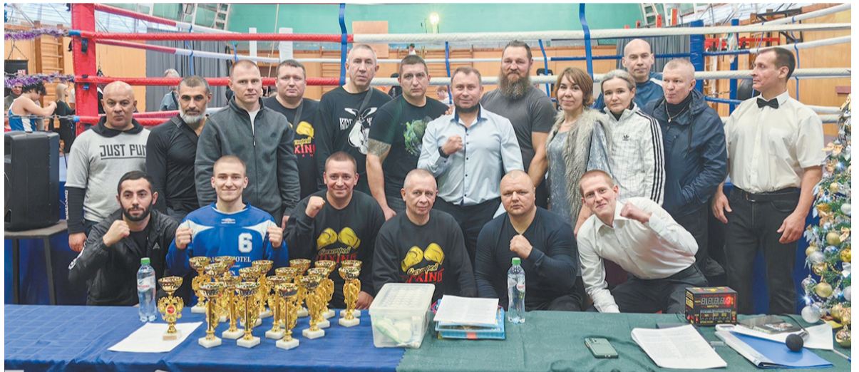
Открытый ринг по боксу в Отрадном в 2024 году