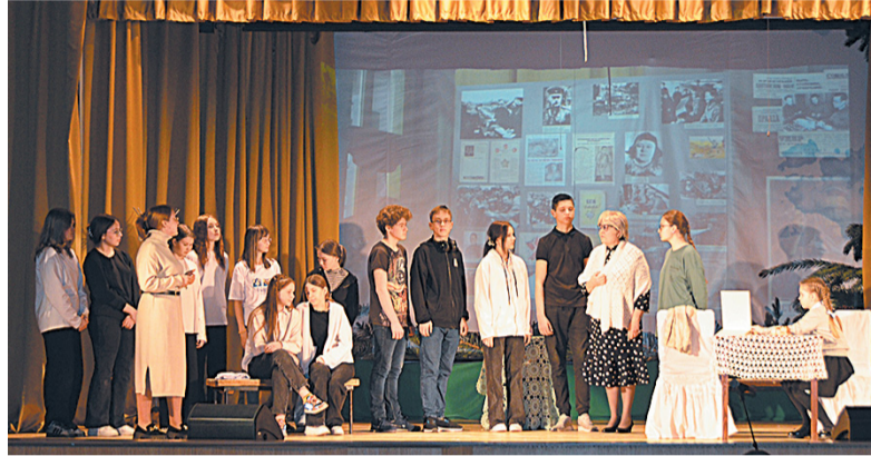
Документальная постановка к 80-й годовщине полного освобождения Ленинграда от немецко-фашистской блокады «Книга памяти о мужестве». Театральная мастерская «Цветы жизни» КЦ «Фортуна»