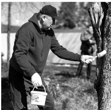
Акцию поддерживает руководство области

КСЕНИЯ БОНДАРЕНКО