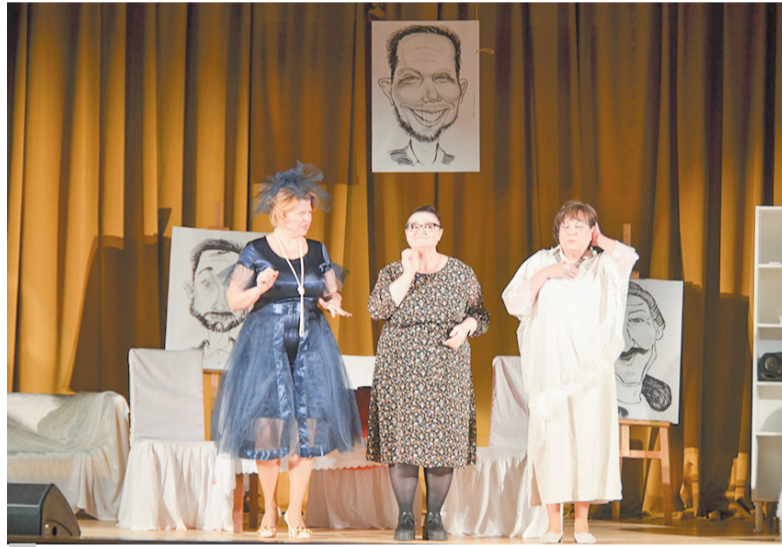
Спектакль «Три красавицы». Театральная лаборатория Г.Л.А.С. КЦ «Фортуна»

по С.Маршаку (театральная студия «Экспромт» культурно-досугового центра «Синявино», режиссер Маргарита Грязнова).