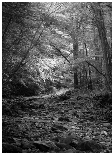
Рагуша, Бокситогорский район

Общая протяжённость маршрута «Мыс Киперорт» составляет 19 километров. Тропа проложена по двум берегам Киперорта — самого крупного полуострова в Выборгском заливе. Маршрут проходит по западному каменистому берегу полуострова и восточному — песчаному. Здесь можно увидеть различные типы лесов, а также остатки фортификационных сооружений времён Второй мировой войны. О местных флоре и фауне можно узнать с помощью экологическо-просветительских щитов, снабжённых картами. Для удобства посетителей обустроены парковочное пространство, туалеты и столбы дополнительной разметки.