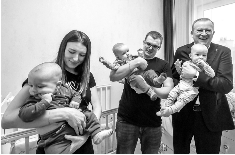
Александр Дрозденко на встрече с многодетными родителями

Что же касается среднего возраста первородящей женщины, то в целом по России он превышает 31 год, а в 47-м регионе составляет около 30 лет. Во многом это следствие жилищного вопроса — сегодня родители хотят растить детей в своих квартирах, а в начале отношений далеко не у всех есть средства на собственное жильё. Молодые люди стремятся получить высшее образование, освоить профессию, накопить на первую ипотеку — и только после этого в семье появляется ребёнок. По-человечески этот подход совершенно понятен, хотя с точки зрения биологии — не совершенен.