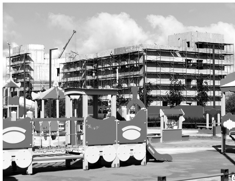
За 2023 год в Ленобласти сдали 25 социальных объектов

КСЕНИЯ БОНДАРЕНКО ФОТО АВТОРА, ПРЕСС-СЛУЖБЫ ПРАВИТЕЛЬСТВА ЛО