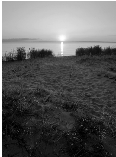
Выбья, Кингисеппский район

Мы же решили рассказать читателям «Ленинградской панорамы» о семи необычных экотропах в разных уголках Ленобласти, построенных за последние годы.