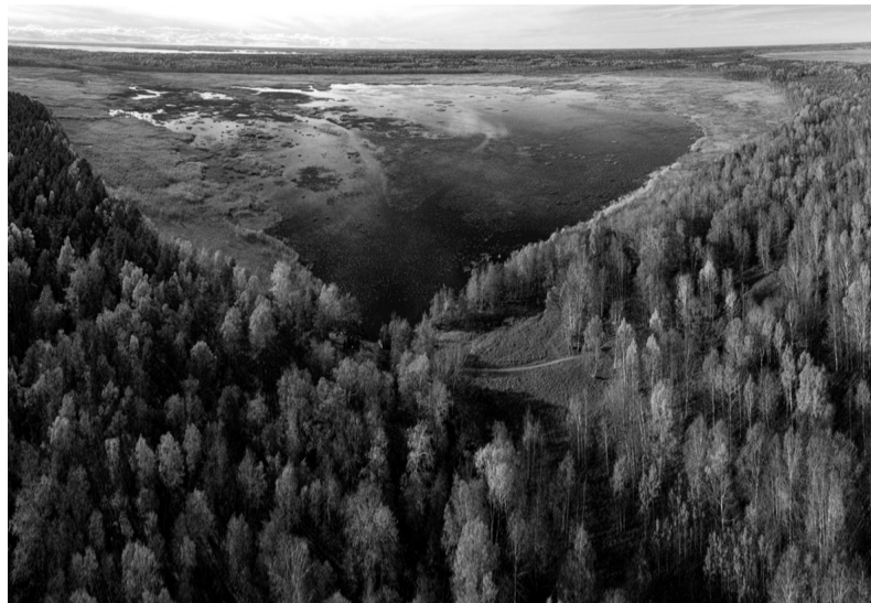
Раковые озёра, Выборгский район