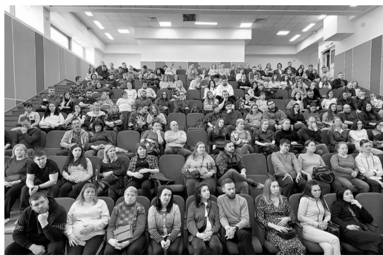
День открытых дверей в Перинатальном центре

В Ленобласти каждая женщина может подготовиться к беременности. Для этого нужно прийти на консультацию к акушеру-гинекологу, он назначит все необходимые исследования, в том числе анализы, позволяющие оценить гормональный статус пациентки. Можно, например, оценить биологический возраст репродуктивной системы женщины, сдав кровь на фолликулостимулирующий гормон (ФСГ) — известный показатель состояния яичников. Важны в этом вопросе и другие маркеры — уровень лютеинизирующего гормона (ЛГ) и антимюллерова гормона (АМГ). По