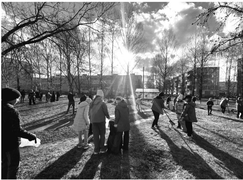
Ленинградцы вышли на первые субботники ещё до официального старта акции