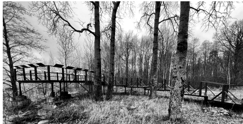
Мыс Кипперорт, Выборгский район

Почти треть тропы оборудована настилами и мости-