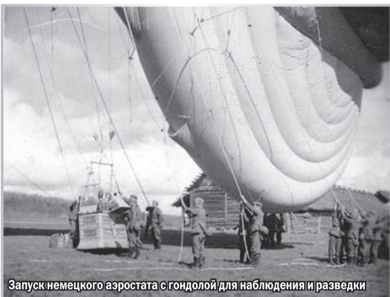
Запуск немецкого аэростата с гондолой для наблюдения и разведки

Для всех, кто интересуется военной историей нашего города, мы продолжаем публикацию материалов из книги «Ивановский порог. Хронология подвига (30 августа 1941 г. – 22 января 1944 г.)». В этот раз речь пойдет о событиях, предшествовавших началу Усть-Тосненской наступательной операции. Догадывался ли враг о готовящемся наступлении наших войск и насколько серьезно он воспринимал происходящее, рассказывает немецкий историк Фридрих Хуземанн.