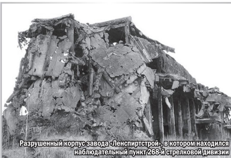
Разрушенный корпус завода «Ленспиртстрой», в котором находился наблюдательный пункт 268-й стрелковой дивизии

Чтобы отвлечь внимание противника и сковать его силы, 15-17 августа войска 55-й армии Ленинградского фронта предприняли ряд атак в долине реки Большая Ижорка в направлении Октябрьской железной дороги. Вот как эти события описывает немецкий историк Ф. Хуземанн в своей книге «Die guten Glaubens waren», посвященной истории боевого пути Полицейской дивизии СС: «... Увеличилось число русских на позициях. Ведутся окопные работы. Батареи поставлены на огневые позиции. Оживленное движение полуторок на дороге Корчино-Колпино. Русские разведгруппы ночью пытались взять пленных. Мы открыли огонь, уничтожили своего пленного. Конечно, предстоит наступление русских...»