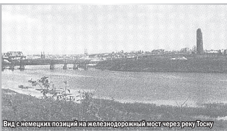
Вид с немецких позиций на железнодорожный мост через реку Тосну