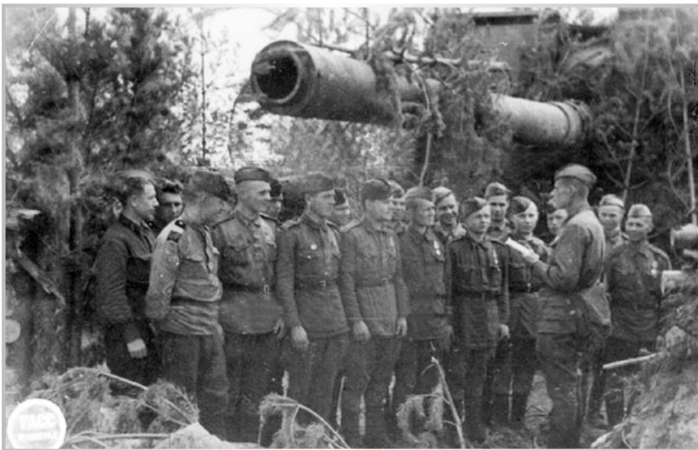
180-миллиметровое орудие. Ленинградский фронт. Лето 1943 года

■ Публикация подготовлена по материалам книги «Ивановский порог. Хронология подвига. (30 августа 1941 г. — 22 января 1944 г.)»