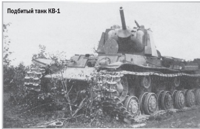
Подбитый танк КВ-1