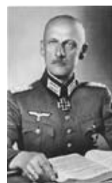
Командующий группы армий «Север» фон Лееб