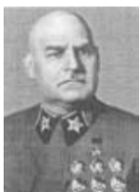
Маршал Г. И. Кулик

Вообще-то 54-я армия маршала Г. И. Кулика, подчинявшейся непосредственно Ставке ВГК, должна была еще 6 сентября «перейти в наступление и в том числе нанести удар вдоль железной дороги Волховстрой — станция Мга. Однако она не успела вступить в бой за Мгу