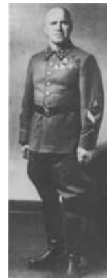
Командующий Резервным фронтом Г. К. Жуков

вызвал Москву. На другом конце линии был маршал Василевский. Жуков сказал: «Командование я принял. Доложите Верховному Главнокомандованию, что постараюсь действовать более активно, чем мой предшественник».