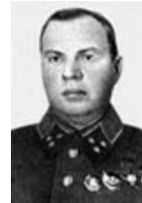
Генерал-лейтенант М. С. Хозин

Рано утром этого же дня с Внуковского аэродрома в Москве под охраной звена истребителей поднялся в воздух самолет Ли-2 и взял курс на Ленинград. На борту находились генерал армии Г. К. Жуков, назначенный командующим Ленинградским фронтом, генералы М. С. Хозин, П. И. Кокорев и И. И. Федюнинский. До Ленинграда летели без приключений. В Смольном Ворошилов, Жданов и Кузнецов ожидали Жукова и его помощников. Процедура вступления в должность была короткой. Подписав оперативные карты, Жуков подошел к телефону ВЧ и