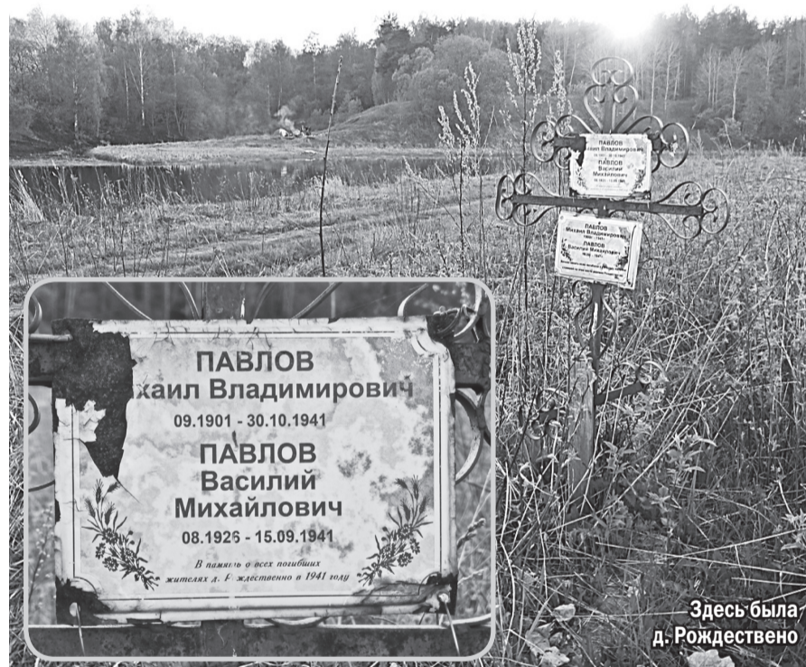
Здесь была д. Рождествено