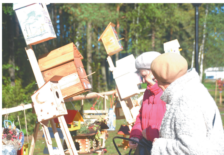
Экологическая акция в Пеллинском экопарке