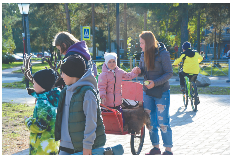
«Аллея мастеров» в Пеллинском экопарке