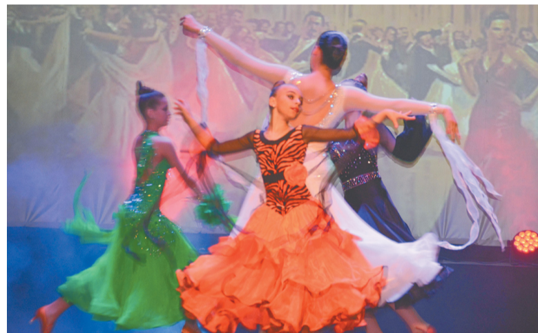
Выступает танцевально-спортивный клуб «Забава»