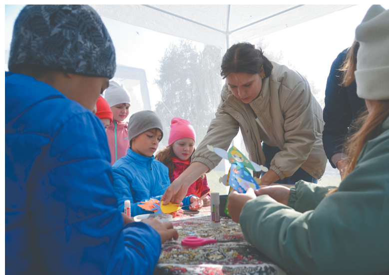
«Аллея мастеров» в Пеллинском экопарке