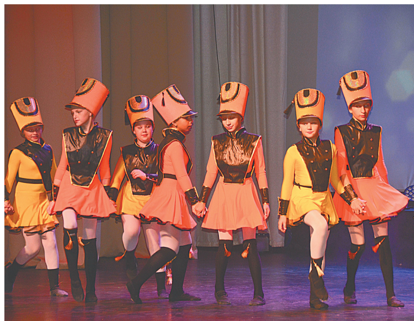
Выступает образцовый самодеятельный коллектив «Вдохновение»