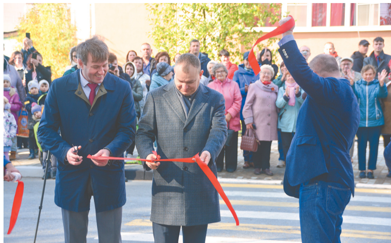
Открытие Пеллинского экопарка