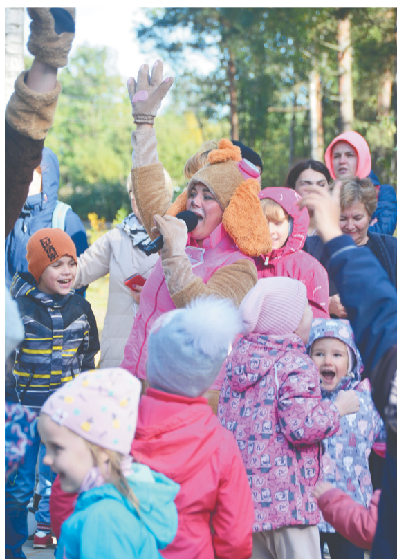
«Аллея мастеров» в Пеллинском экопарке