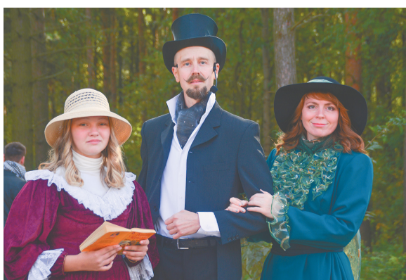
Открытие Пеллинского экопарка. Выступают артисты театральной лаборатории «Г.Л.А.С.»