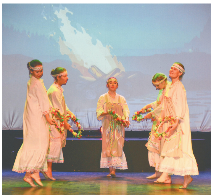
Выступает образцовый самодеятельный коллектив «Вдохновение»