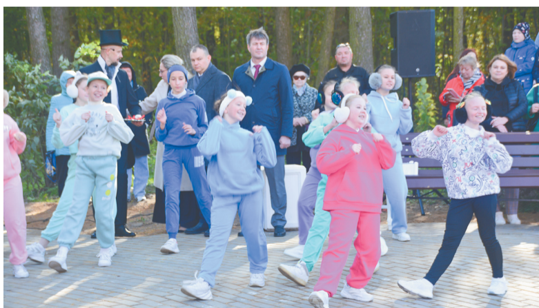
Открытие Пеллинского экопарка. Выступает образцовый самодеятельный коллектив «Вдохновение»