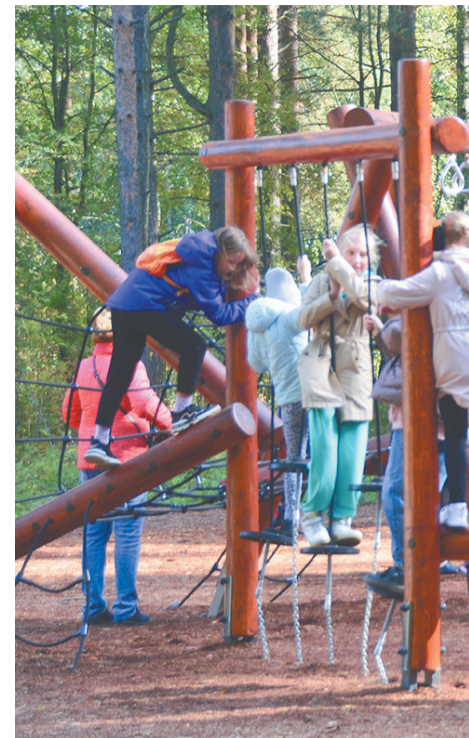
«Аллея мастеров» в Пеллинском экопарке