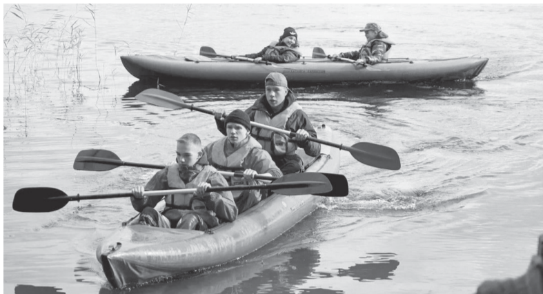
Участники похода дружно покоряли водную стихию