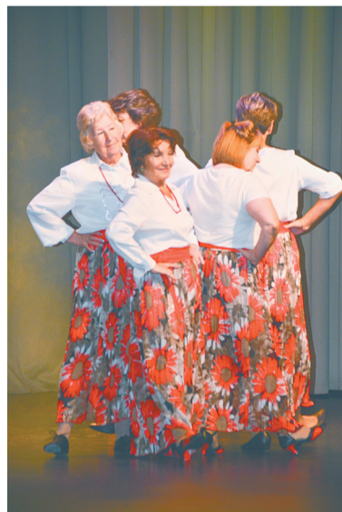
Выступает коллектив «Элегия»