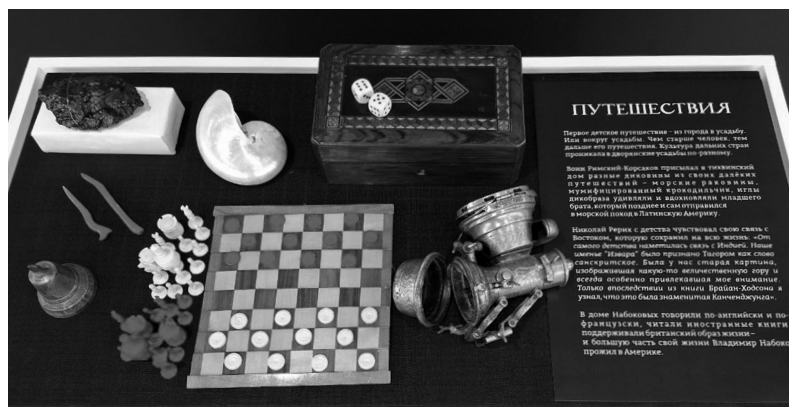
Дорожный набор путешественника начала XX века

Забавно рассматривать метафорические ландшафты усадеб, в которых выросли гении русской культуры. Это не точные макеты имений, а видение художника, рождённое после прочтения писем, воспоминаний, биографического набоковского романа «Другие берега».