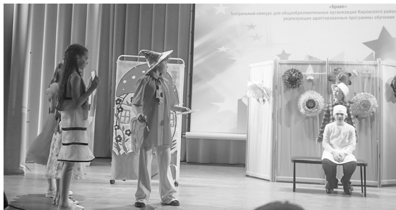
Театральная студия «Рассвет» Мгинской средней общеобразовательной школы. Постановка по мотивам произведения А.Пушкина «Евгений Онегин»