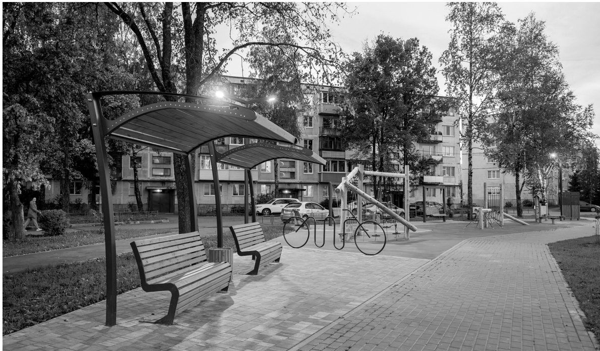
Общественное пространство в Пудомягах вошло в список лучших объектов благоустройства Минстроя РФ

— Встречаемся и общаемся с жителями небольших населённых пунктов, где в 2025 году по президентскому нацпроекту «Жильё и городская среда» планируется благоустройство общественных территорий. Сначала