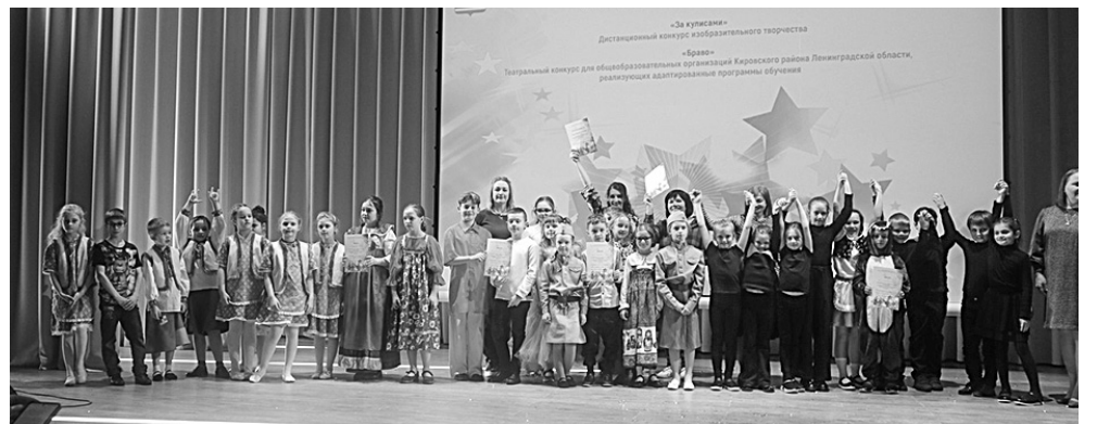
Награждение призеров в номинации «Художественное слово» (групповое прочтение произведения)