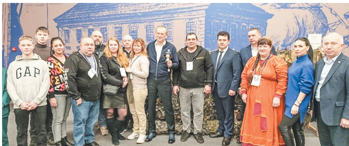
В Экспофоруме на мероприятии «Русские меняют мир» с губернатором Ленинградской области Александром Дрозденко