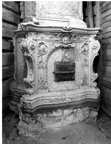
Старинный камин в усадьбе Киискиля