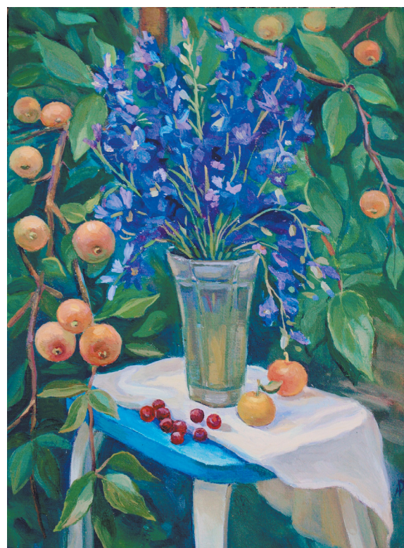
Этюд с веткой яблони. 2023. Холст, масло