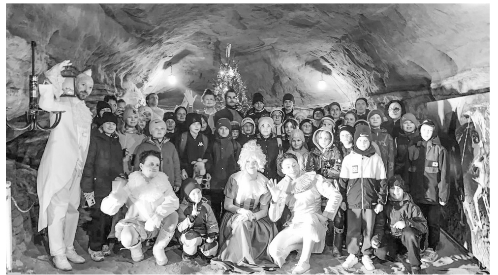
Школьники и артисты театра NON STOP