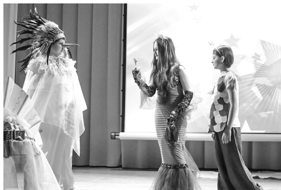
Театральный коллектив «В гостях у сказки» Шлиссельбургской СОШ №1. Миниатюра по мотивам сказки Ш.Перро «Красная Шапочка»