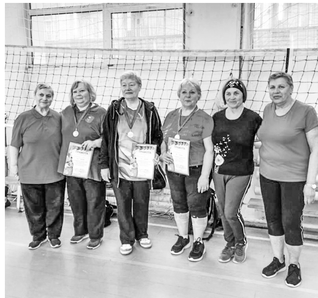
Финалисты турнира среди женщин