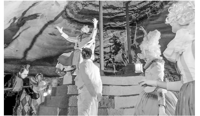
Король, Чернушка и Алёша

Когда вместе собираются геологи, режиссеры, актеры, техники и другие активисты, получаются настоящие шедевры. А если их поддерживает Президентский фонд культурных инициатив — шедевры становятся доступными общественности. Именно таким является реализуемый общественной организацией «Сохранение природы и культурного наследия» волшебный проект «Театр диковинок Черной курицы», благодаря которому 22 апреля учащиеся Лицея города Отрадное побывали в царстве Саблинских пещер.