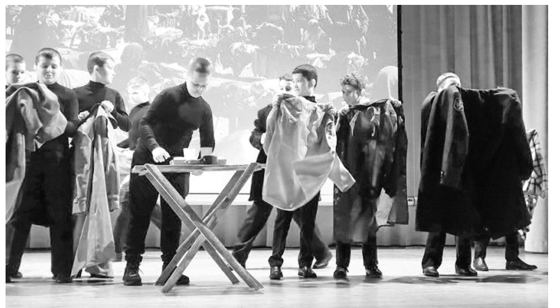
Награждение призеров в номинации «Театральная миниатюра», возрастная категория 9–11 класс