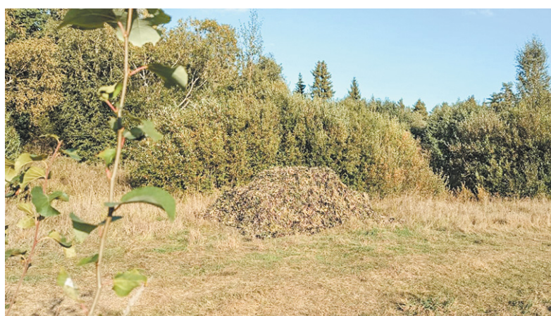
Объект, замаскированный в поле сетями