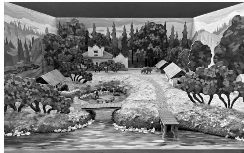
Усадебное детство связывает судьбы Набокова, Рериха и Римского-Корсакова