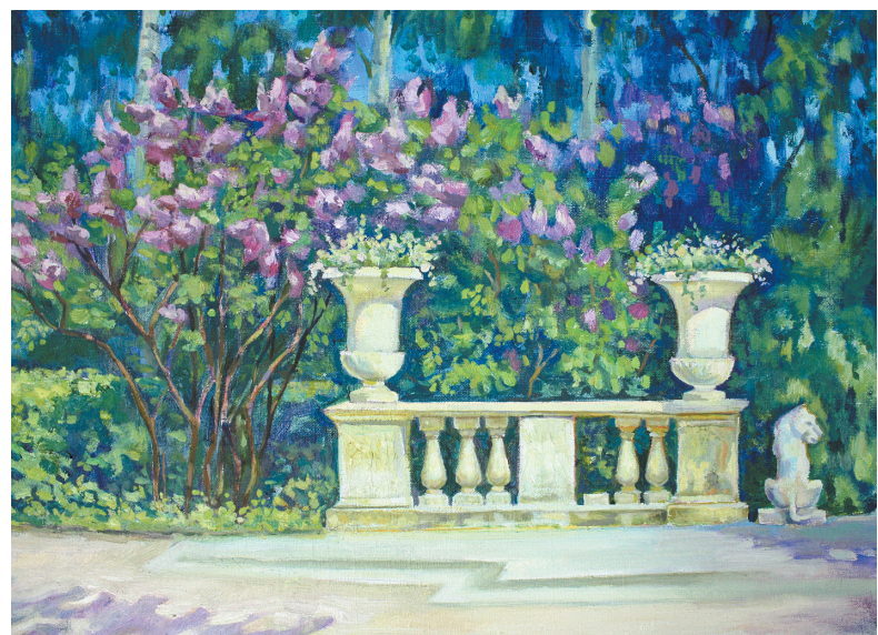
Павловск. Цветет сирень. 2017. Холст, масло