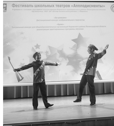
Театральная студия «Позитив» Районного центра дополнительного образования (Кировск). Постановка «Небылицы в лицах» по мотивам Г.Саггира