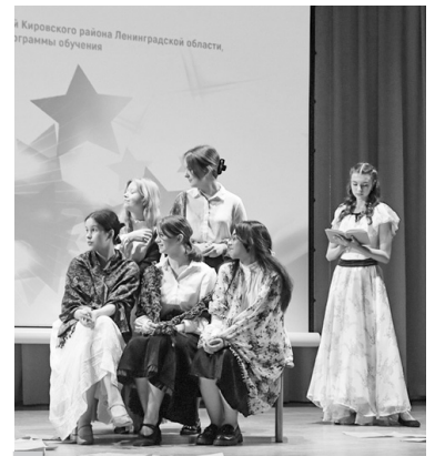
Театральная студия «Чемодан» Отрадненской СОШ №3. Постановка по мотивам произведения Н.Носова «Приключения Незнайки»