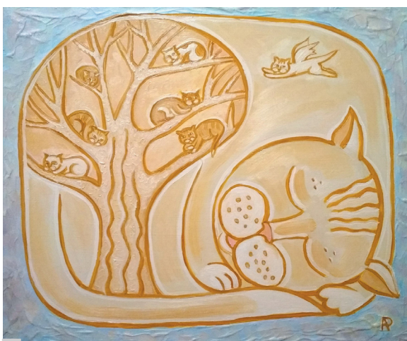
Теплые сны. 2018. Холст, масло