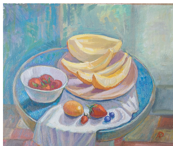
Натюрморт с дыней. 2023. Холст, акрил

Когда: до 20 мая. Где: культурный центр «Фортуна» (Отрадное, ул. Гагарина, 1, 2-й этаж), с 11:00 до 20:00.