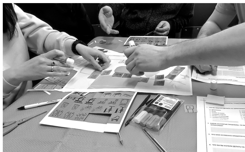
На проектировочной сессии жители посёлка могли выбрать наполнение проекта благоустройства

КСЕНИЯ БОНДАРЕНКО ФОТО АВТОРА, ЦЕНТРА КОМПЕТЕНЦИЙ ЛО