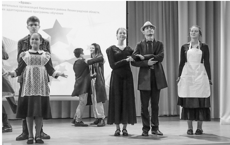
Детское объединение «Наш друг театр» Центра внешкольной работы города Отрадное. Постановка «Ленька Пантелеев» по мотивам произведения Г.Белых и Л.Пантелеева «Республика ШКИД»