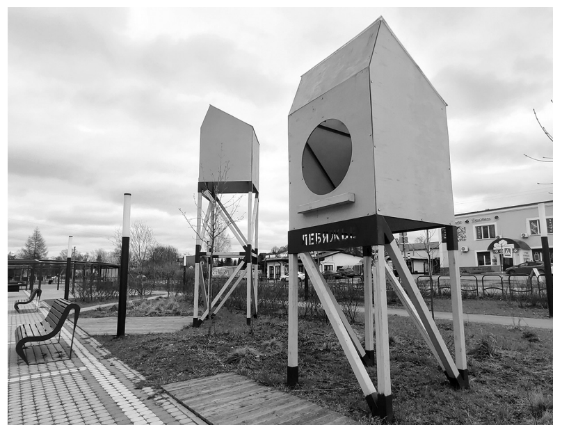
Птичья площадь в посёлке Лебяжье

В планах на 2025 год — благоустройство водоёма и сквера на улице Приморской. Туристам эти места знакомы по расположенному неподалёку штурмовику Ил-2 — памятнику «Защитникам ленинградского неба». Да и та самая Птичья площадь находится совсем рядом. Так что