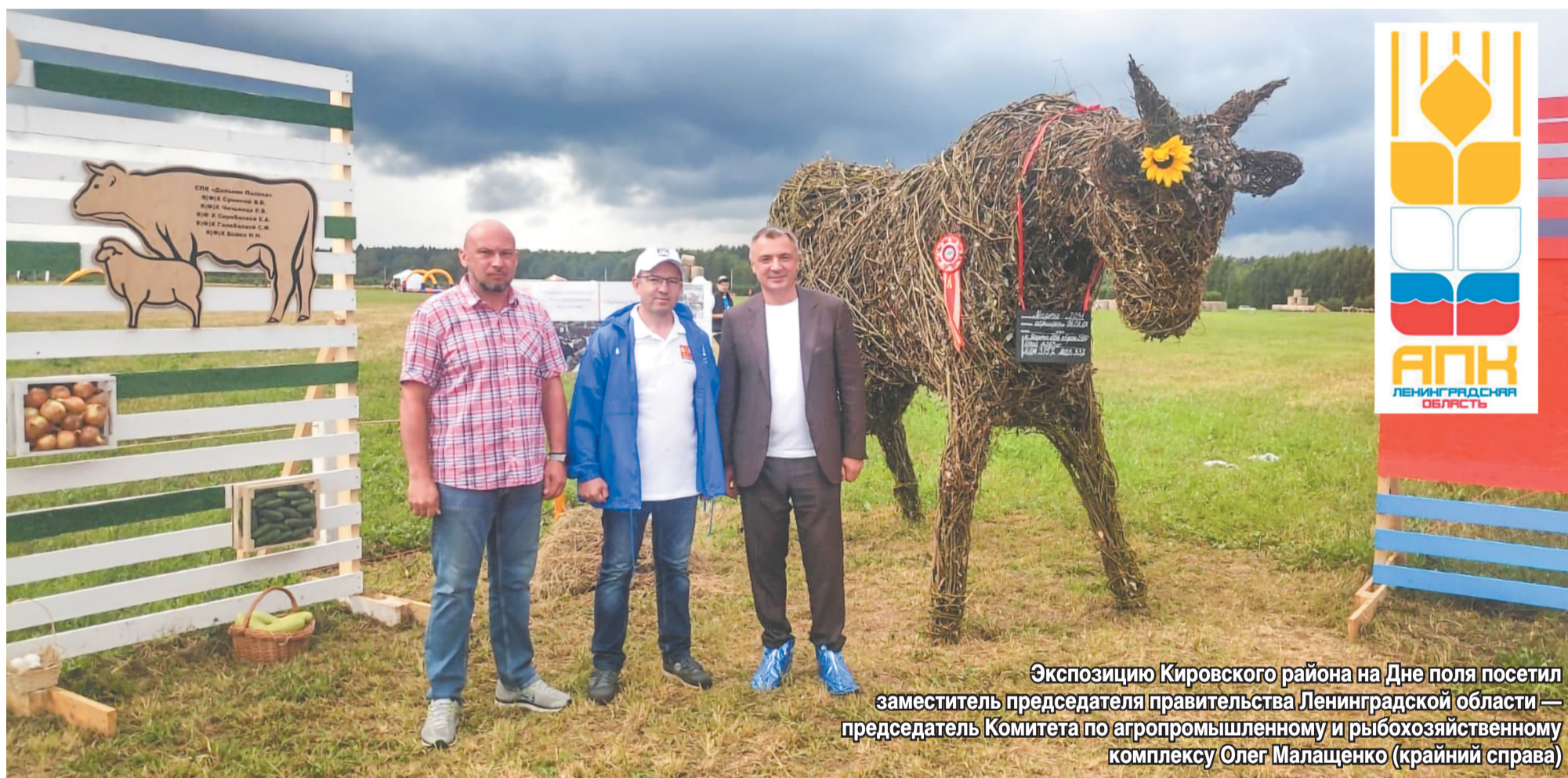
Экспозицию Кировского района на Дне поля посетил заместитель председателя правительства Ленинградской области — председатель Комитета по агропромышленному и рыбохозяйственному комплексу Олег Малащенко (крайний справа)

С 18 по 20 июля в Лужском районе на территории племенного завода «Рапти» проходила ежегодная сельскохозяйственная выставка-ярмарка «День Поля Ленинградской области». Организатором этого парада предприятий АПК выступает региональный Комитет по агропромышленному и рыбохозяйственному комплексу. У каждого района здесь была своя территория-стенд, где можно было продемонстрировать местные достижения и продукцию. Кировский район не остался в стороне.