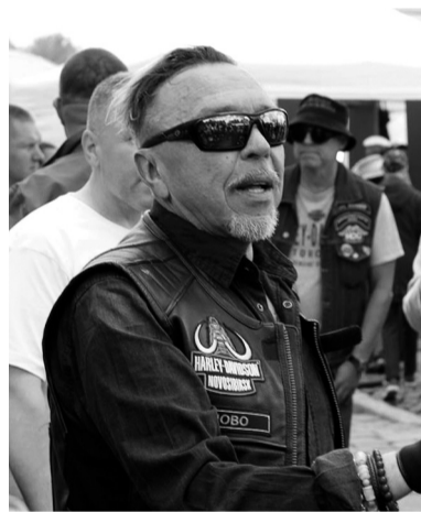
Гарик Сукачёв на патриотическом мото

К слову, вопреки всем санкциям, фестиваль сохранил международный статус. Мы, например, пообщались с байкером из Казахстана Дмитрием Петрухиным.