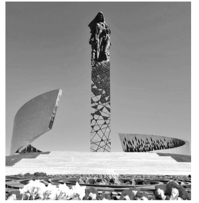
Монумент жертвам геноцида в Зайцево

В округе стартовало строительство детского сада и школы в Коммунаре, подходят к концу строительные работы в гатчинской школе № 4. В планах — создание культурно-спортивного центра на площадке ФОКа в Мариенбурге, создание Центра творческого развития в микрорайоне Аэродром. Есть и другие идеи: например, строительство регионального конгресс-холла или культурно-делового центра. Идея уже поддержана губернатором, и площадки для этого в Гатчинском муниципальном округе есть.