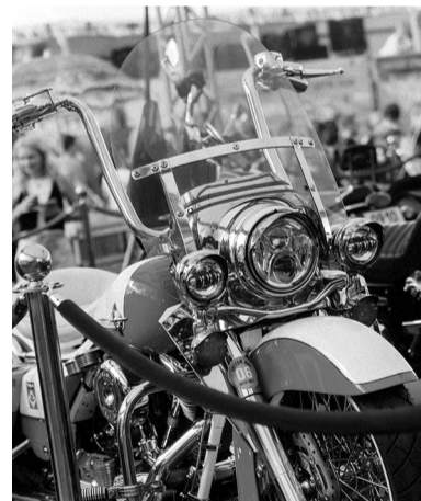
Традиционная выставка ретро-байков

Причём патриотизм — это широкое понятие. Патриотизм — это и любовь к Родине. Кроме того, патриотизм — это пропаганда красоты нашей страны, здорового образа жизни. А байкер — это всё-таки здоровый образ жизни. У нас есть свои принципы. Мы не нарушаем правила. Мы вежливы на трассе. Мы помогаем тем, кто на трассе попал в беду. А самое главное — мы пропагандируем то, что в путешествии ты узнаёшь свою страну. И, конечно, для нас сегодня патриотизм — это поддержка наших ребят в зоне Специальной военной операции. И мы все уверены в нашей Победе.