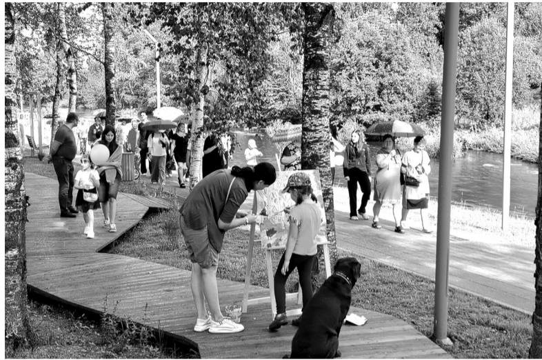
В Гатчинском округе активно идёт благоустройство территорий

СТОЛИЦА ЛЕНОБЛАСТИ ВНОВЬ СТАЛА ПРИМЕРОМ ДЛЯ ДРУГИХ МУНИЦИПАЛЬНЫХ ОБРАЗОВАНИЙ