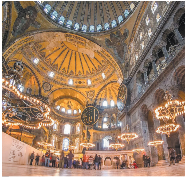
Собор Святой Софии (Стамбул, Турция). Современный вид