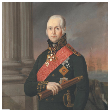
Портрет адмирала Ф.Ушакова. 1850. Художник неизвестен. Государственный Эрмитаж

Фёдор Фёдорович Ушаков (1745–1817) известен как выдающийся флотоводец, командующий Черноморским флотом и российской эскадрой в Средиземном море, герой русско-турецких войн, основатель русской тактической военно-морской школы. На Востоке его называли непобедимым Ушак-пашой, потому что Фёдор Фёдорович одержал победу в 43 морских сражениях (в том числе в пяти крупнейших: при Фидониси, Керчи, Корфу, мысах Тендра и Калиакрия), не потерпел ни одного поражения, не потерял в боях ни одного ко-