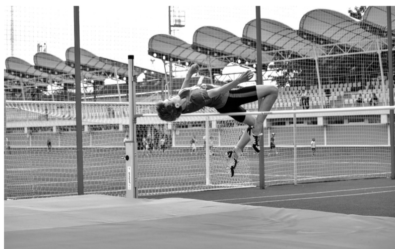
День защиты детей на стадионе «Спартак»

В округе ведётся капитальный ремонт домов-памятников и реставрация объектов культурного наследия. Долгожданным событием стало открытие Павильона Орла в Дворцовом