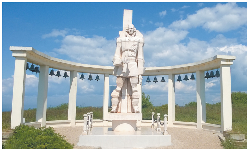
Памятник Ф.Ушакову на мысе Калиакрия (Болгария)

28 июля — День Военно-Морского Флота РФ. Подготовка к этой дате состоит не только в репетиции парада, но и в серии молебнов у мощей адмирала Фёдора Ушакова, признанного святым покровителем российского ВМФ и стратегических военно-воздушных сил. Для этого нетленные останки праведного воина ежегодно привозят из Санакарского мужского монастыря Республики Мордовия в Никольский Морской собор города Кронштадта. В этом году в течение трех дней мощи непобедимого флотоводца также были доступны прихожанам и туристам в Казанском кафедральном соборе в Санкт-Петербурге.