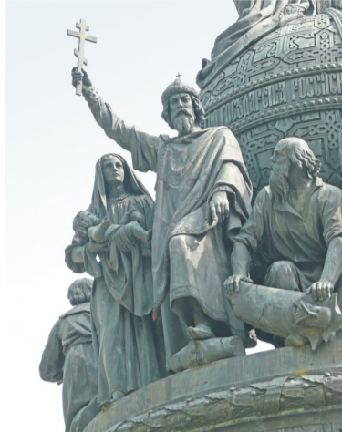
Князь Владимир на памятнике «Тысячелетие России» в Великом Новгороде

Князю пришлось выбирать между западным римским и восточным христианством, исламом и иудаизмом. Укрепление государства требовало принятия единой веры, но какой? И Владимир взял на себя труд изучить все четыре господствовавшие религии. Желая веры истинной не для себя одного, но для всего народа, князь держал совет с боярами и городскими старейшинами. В итоге было решено отправить посланников в разные концы, чтобы посмотреть, в какой стране «лучше служат Богу».