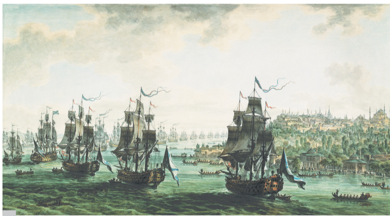
Российская эскадра под командованием Ф.Ушакова, идущая Константинопольским проливом. 1799. Художник М.Иванов. Государственный Русский музей

Адмирал Фёдор Ушаков — святой покровитель Военно-Морского Флота России