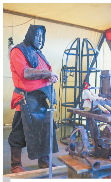
Во дворе у средневекового палача