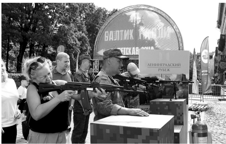
Стенд фонда «Ленинградский рубеж» пользовался популярностью у молодёжи