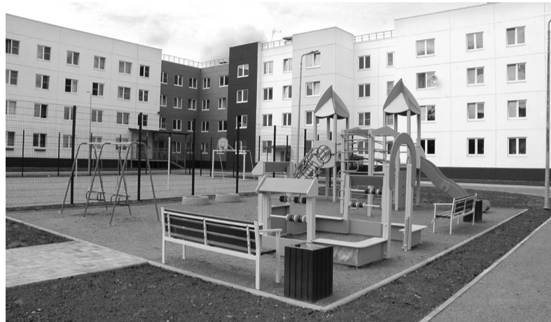
В Волхове строятся новые комфортные жилые дома

Лидирует Волховский район и по темпам расселения аварийного жилья. В декабре 2023 года было завершено строительство дома по улице Работниц — в нём