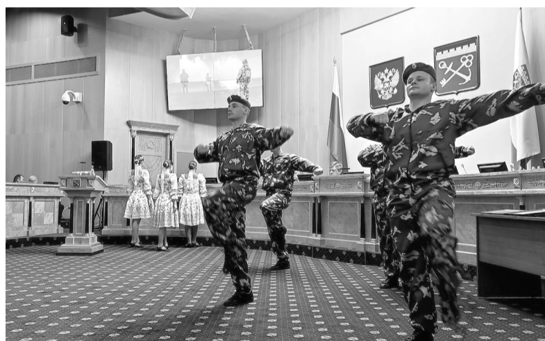
Выступление ансамбля «Невский дозор»

— Хочу заверить от имени выпускников высших и средних военных учебных заведений о готовности добросовестно и профессионально исполнять свой воинский долг, достойно продолжать славную историю предшественников, чтить и приумножать традиции пограничной службы ФСБ России, оправдать ваше доверие и доверие граждан России, — выступил с речью награждённый лейтенант, выпускник Института береговой охраны ФСБ России. — Мы удостоены высокой чести стать сотрудниками пограничных органов и защищать Россию и рубежи Отечества в регионе, являющемся по праву культурно-историческим наследием России. Для нас навеки останется примером подвиг жителей и защитников блокадного Ленинграда, покрытый славой и увековеченный в памяти народа.