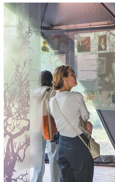
На экспозиции.