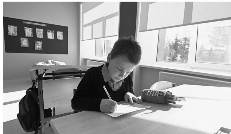
Гостинопольская школа после капитального ремонта

«ФосАгро» также поддерживает социальные проекты Волховского района. В том числе оснащает учреждения высокотехнологичным оборудованием, строит дома для сотрудников, благоустраивает территории, сотрудничает с Волховским многопрофильным техникумом и местными школами. Общий объём финансирования социальных и благотворительных проектов в Волхове превышает 520 млн рублей.