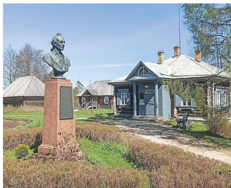
Музей-усадьба А.В.Суворова в селе Кончанское Новгородской области.