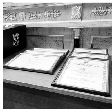
Награды получили 12 офицеров погранслужбы