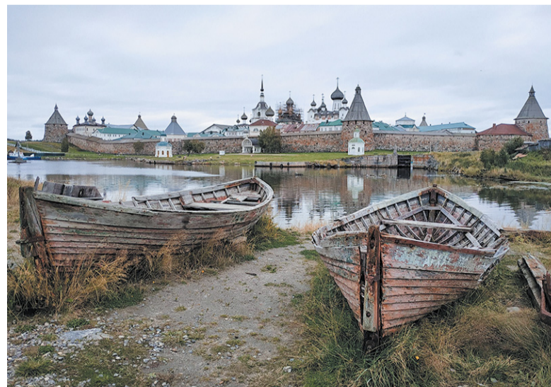
Соловецкий монастырь.