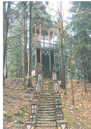
Башня Шехерезады.