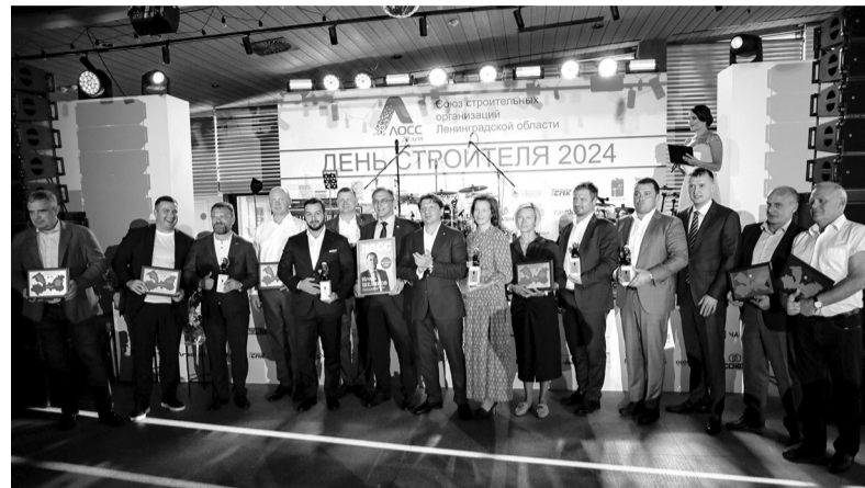
Церемония награждения лучших застройщиков 47-го региона

— Это видно невооружённым взглядом. Достаточно посмотреть на стройки и проанализировать цифры. Сейчас регион постепенно отходит от строительства «миниатюрных» квартир. Согласно постановлению, подписанному губернатором, жилпло-