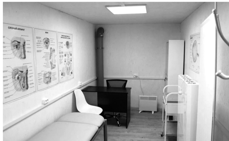
Подземный госпиталь, построенный Ленинградской областью в прифронтовой зоне

МАТЕРИАЛ ПОДГОТОВЛЕН ФОНДОМ «ЛЕНИНГРАДСКИЙ РУБЕЖ»