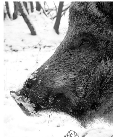
Дикие свиньи живут в Ленобласти с 1947 года

Родильное гнездо часто строится под низко опущенными ветвями крупных елей. Самка пастью обламывает ветки и аккуратно укладывает их своим рылом. Дно гнезда выстилается мхом или па-