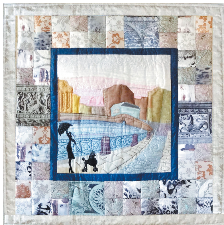
Работа Ирины Можяевой