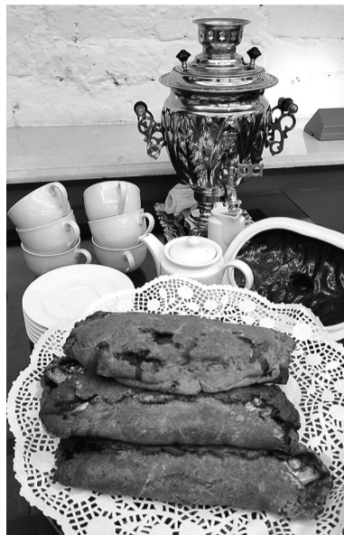
Знаменитый рыбник из Шлиссельбурга

подготовил Музей истории города Шлиссельбурга — «Гастрономический вояж».