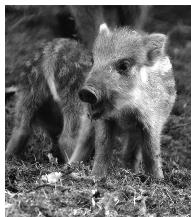
Кабаны — самые плодовитые животные среди копытных

О присутствии этих животных в лесу мы узнаём по участкам земли, которые перепаханы, словно трактором. За день один кабан при помощи своего ловкого и сильного рыла может вспа-