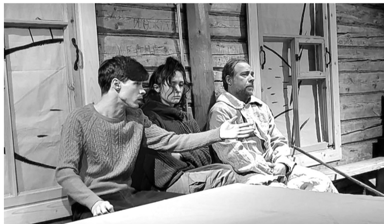
В Выре сцену артистам заменило пространство деревянного дома

АЛЕКСАНДРА СИДОРОВА