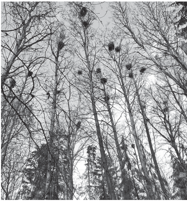
Гнёзда в цапельнике

Интересно, что уже не первый год в Ленинградской области обнаруживается несколько мест (в том числе, два — в Гатчинском округе), где серые цапли остаются зимовать. В каждом