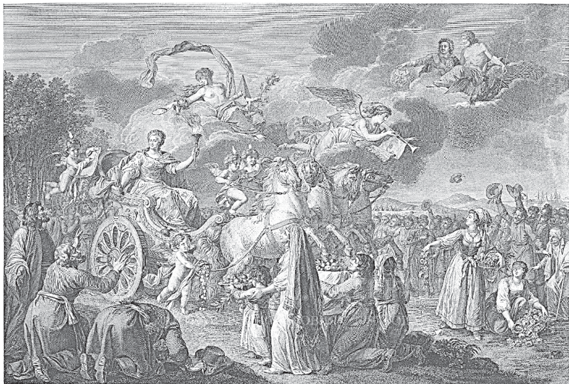
Е.К. КАТЕРИНА II путешествующая в своем Государстве в 1787 году, поощряя и подвизая ее министров, Величества Са подвизая всероссийской величайшей в Свободу, Греческой, и прочей.