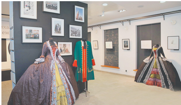
Фрагмент выставки «Михаил Шемякин. Художник и театр».

Премьера «Щелкунчика» в постановке Льва Иванова состоялась в Мариинском театре в Петербурге 6 (18) декабря 1892 года. Главную роль испол-