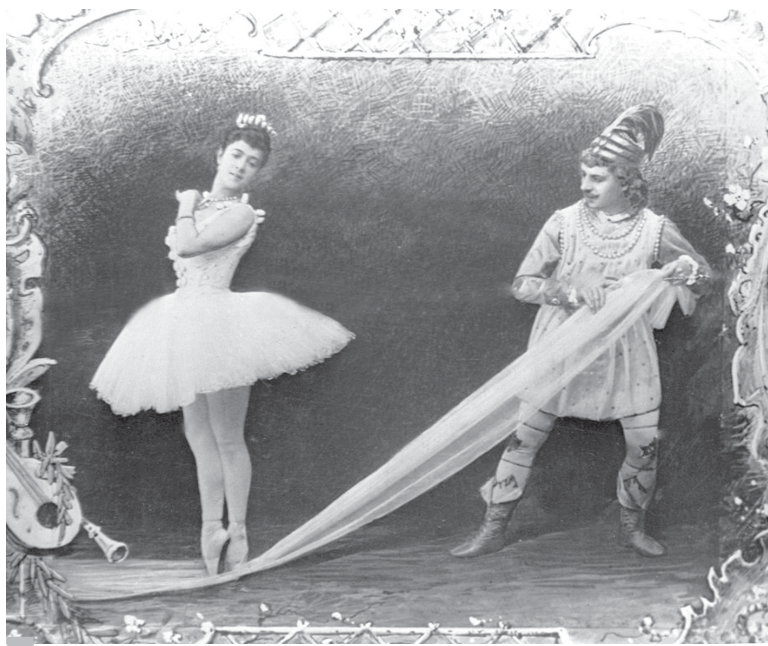
Премьера балета 6 (18) декабря 1892 г. в Мариинском театре в Петербурге.

жизнь представлялась узилищем, откуда они видели выход только в поэзию, в музыку, в сказку... А восприятие поэта или художника сродни живому восприятию ребенка, когда мир открыт для тебя во всех своих многообразных возможностях. Внимание же автора к деталям произведения, их продуманность и правдоподобность «цепляла» и «серьезных» людей. Так, прусский военачальник Август Гнейзенау был крайне впечатлен убедительными батальными сценами с участием мышиного войска и армии кукол.