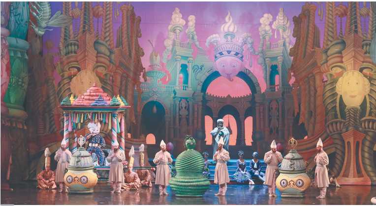
Сцена из балета «Щелкунчик». Постановка М.Шемякина. 2023 г.