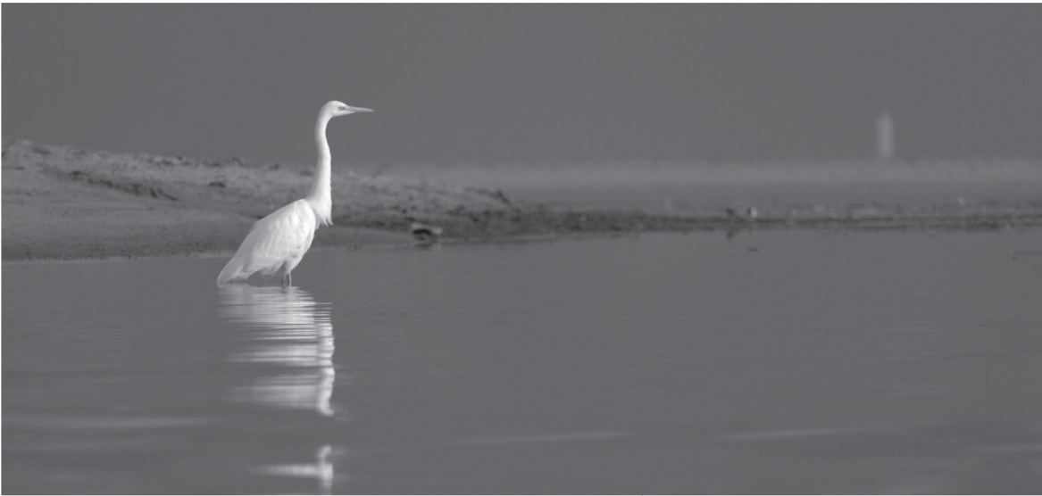
Белая цапля на Финском заливе в Ломоносовском районе Ленинградской области