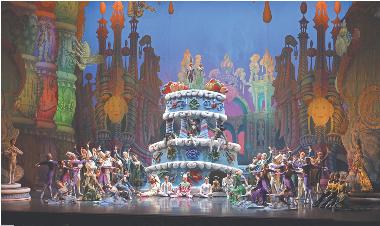
Сцена из балета «Щелкунчик». Постановка М.Шемякина. 2022 г.