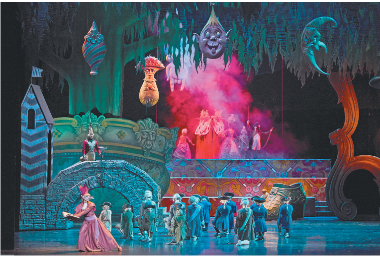
Сцена из балета «Щелкунчик». Постановка М.Шемякина. 2024 г.