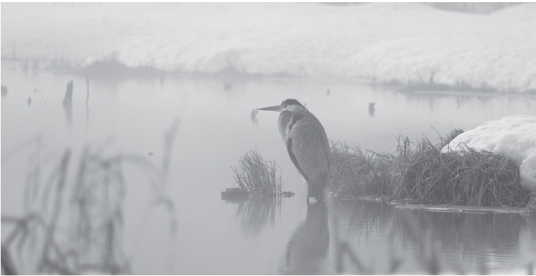
Серая цапля зимой в Гатчинском округе

Цапли ведут дневной образ жизни. Предпочитают крупные водоёмы с мелководьями, подходящими для рыбалки, — это могут быть реки с низкими заросшими берегами, озёра и пруды. При этом гнездиться они могут в некотором отдалении от воды.