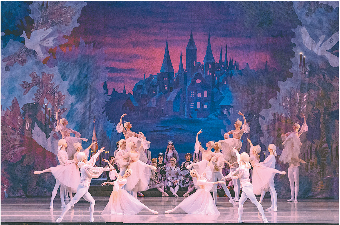
Сцена из балета «Щелкунчик». Постановка В.Вайнонена. 2022 г.