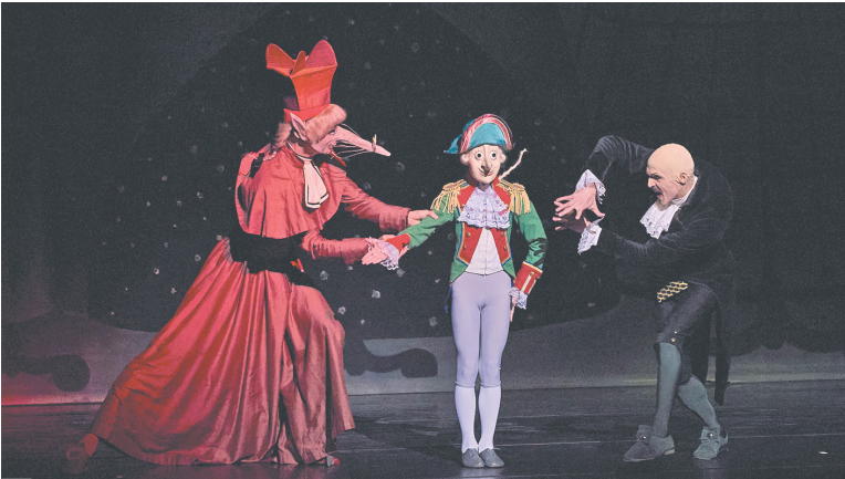
Сцена из балета «Щелкунчик». Постановка М.Шемякина. 2024 г.