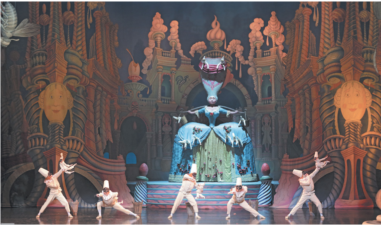
Сцена из балета «Щелкунчик». Постановка М.Шемякина. 2022 г.