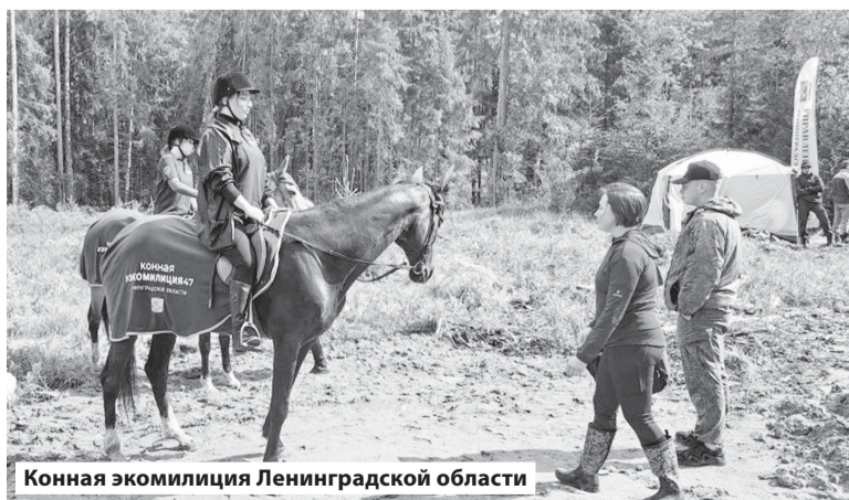
Конная экомиллиция Ленинградской области

Опыт Ленинградской области был высоко оценён участниками сессии как комплексный и заслуживающий тиражирования.