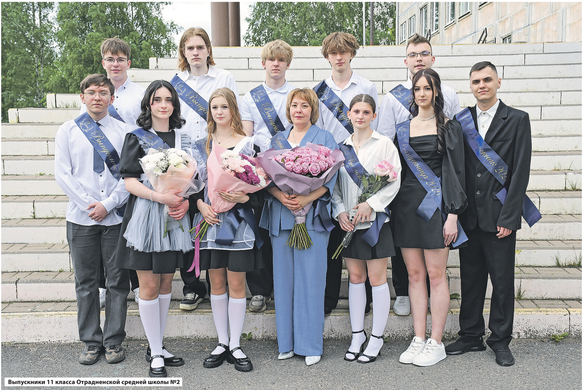
Выпускники 11 класса Отрадненской средней школы №2

Торжественные линейки, слова благодарности учителям и родителям, улыбки и слёзы — этот день стал особенным для сотен выпускников, которые прощаются с детством и делают шаг во взрослую жизнь.