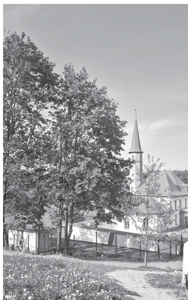
Приоратский дворец в Гатчине