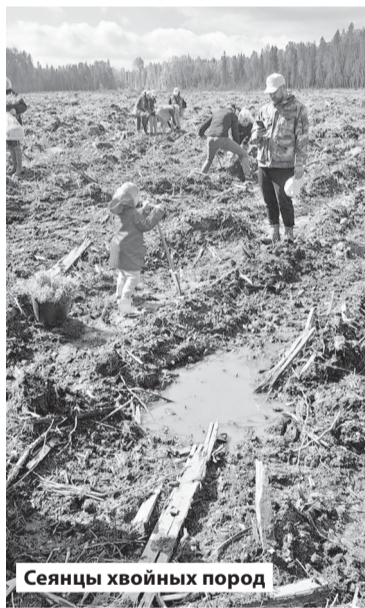
Сеянцы хвойных пород

Всего в период проведения акции в Ленобласти высажено 210 000 сеянцев сосны и ели на 23 участках общей площадью 90,4 га во всех лесничествах —