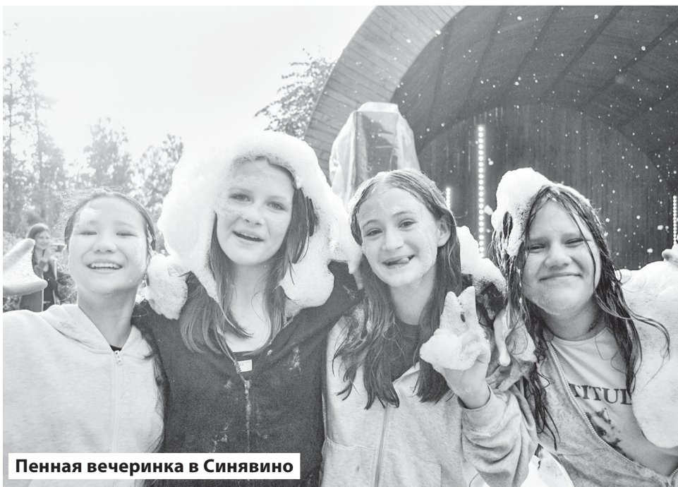
Пенная вечеринка в Синявино