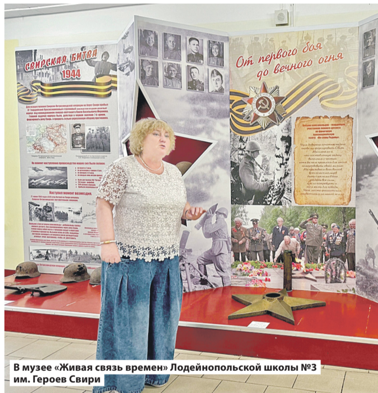
В музее «Живая связь времен» Лодейнопольской школы №3 им. Героев Свири