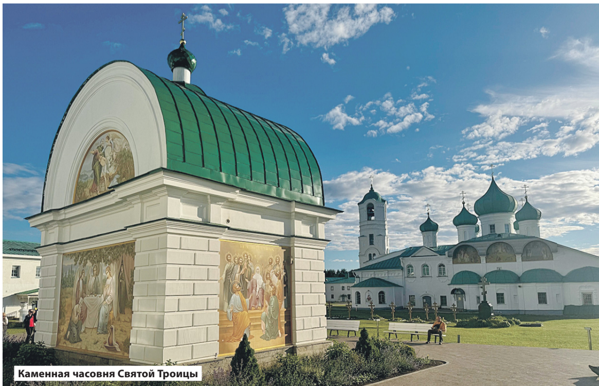
Каменная часовня Святой Троицы

25 июня состоялся традиционный двухдневный семинар-встреча депутатов Законодательного собрания Ленинградской области с руководителями СМИ 47-го региона. В ходе мероприятия народные избранники подвели итоги деятельности Законодательного собрания Ленинградской области седьмого созыва и ответили на вопросы журналистов. Затем для представителей региональной прессы была организована культурная программа, участники которой посетили Лодейнопольский район, узнали его историю, познакомились с промышленностью, увидели объекты благоустройства города и присоединились к церемонии торжественного открытия памятного знака воинам-омичам, принимавшим участие в Свирско-Петрозаводской операции.