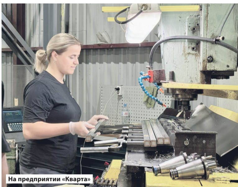
На предприятии «Кварта»

Знакомство с историей Лодейного Поля продолжилось на благоустроенной набережной реки Свирь, которая сегодня является настоящим украшением города. Преображенный по программе «Комфортная городская среда» сквер Корабелов стал уютным об-