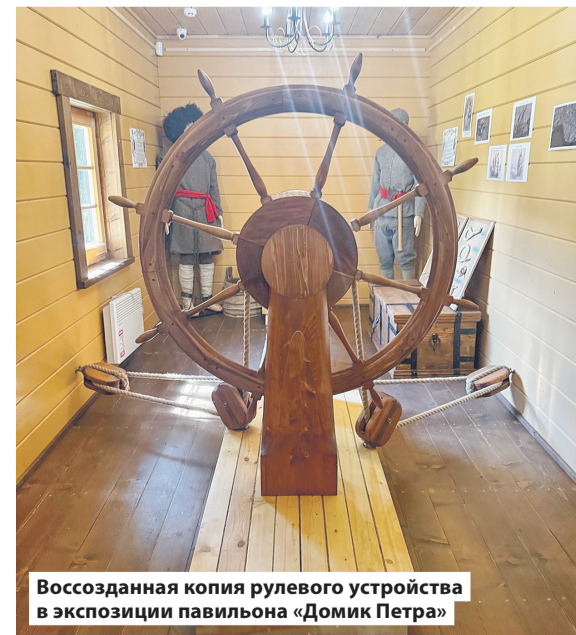
Воссозданная копия рулевого устройства в экспозиции павильона «Домик Петра»