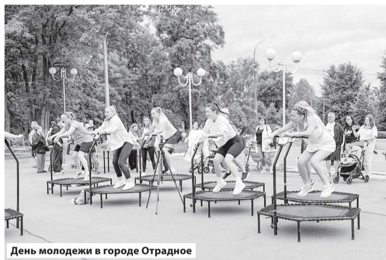
День молодежи в городе Отрадное

морем эмоций! Для желающих раскрыть свой творческий потенциал была организована «Творческая мастерская», где взрослые и дети пробовали себя в разных техниках и создавали собственные уникальные произведения.