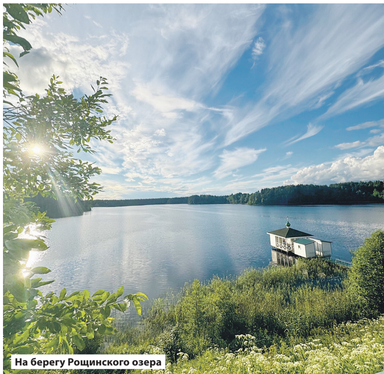
На берегу Рошинского озера