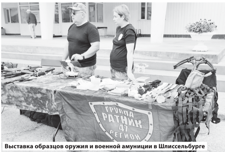
Выставка образцов оружия и военной амуниции в Шлиссельбурге

Во время торжественной части мероприятия самая активная молодёжь поселка была награждена благодарственными письмами.