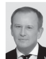
АЛЕКСАНДР ДРОЗДЕНКО, ГУБЕРНАТОР ЛЕНИНГРАДСКОЙ ОБЛАСТИ

Смотреть на игру «Ленинградца» в этом сезоне — было одно удовольствие. Терпеливые, собранные. Ребята сделали всё, что от них зависело, и сделали это хорошо. С возвращением в Первую лигу! И с титулом чемпионов! Ленинградцы гордятся своим «Ленинградцем».