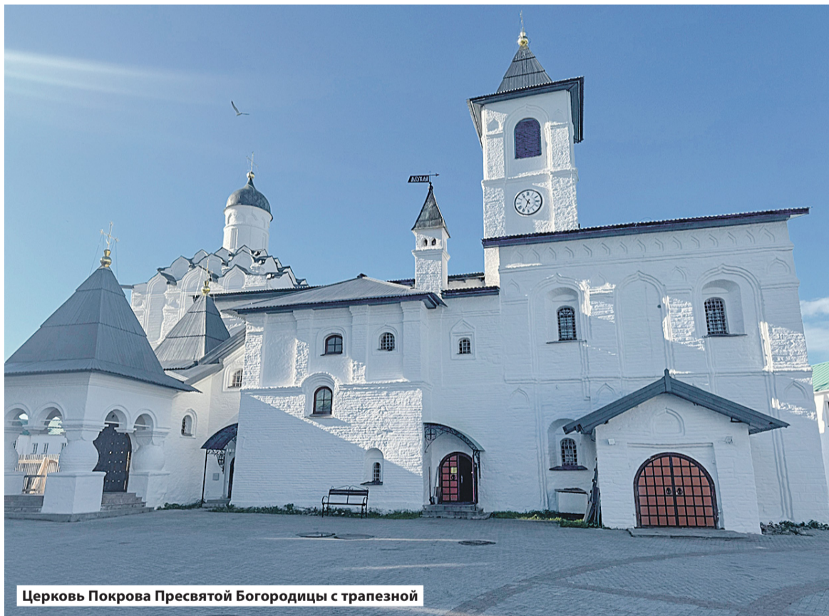
Церковь Покрова Пресвятой Богородицы с трапезной