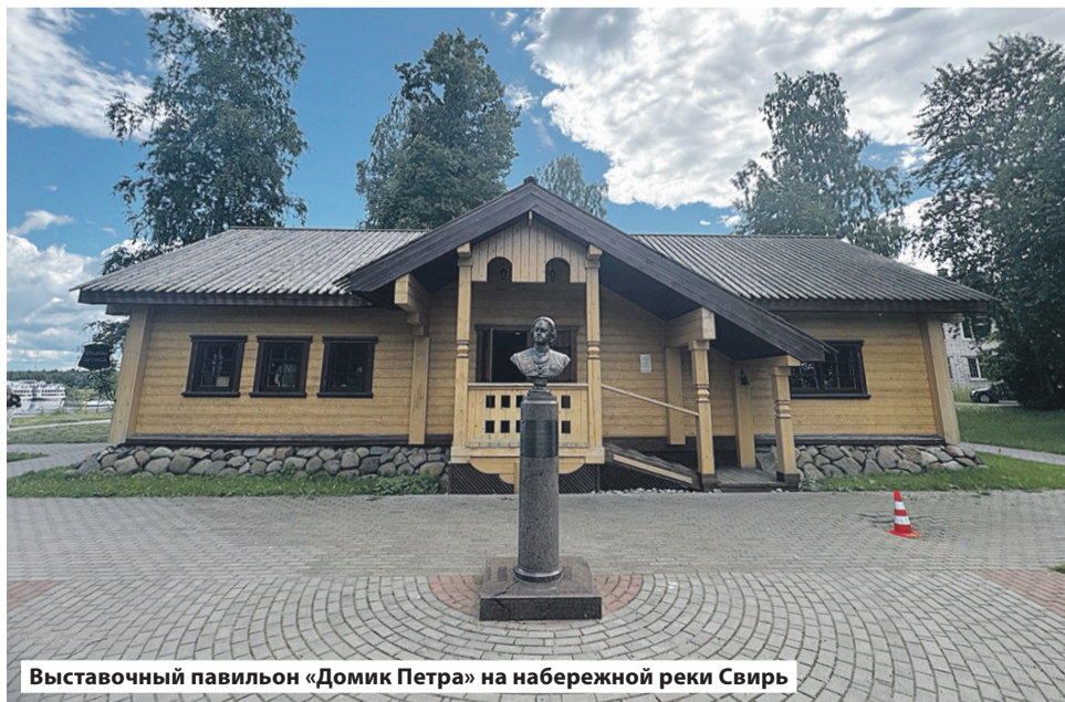
Выставочный павильон «Домик Петра» на набережной реки Свирь