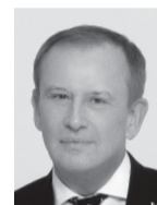
АЛЕКСАНДР ДРОЗДЕНКО, ГУБЕРНАТОР ЛЕНИНГРАДСКОЙ ОБЛАСТИ

Область уже распахнула перед вами двери: 9440 бюджетных мест в колледжах и техникумах, 1774 — в вузах. Мы ждём вас в промышленности, науке и творчестве. Ваши руки и идеи здесь действительно нужны.