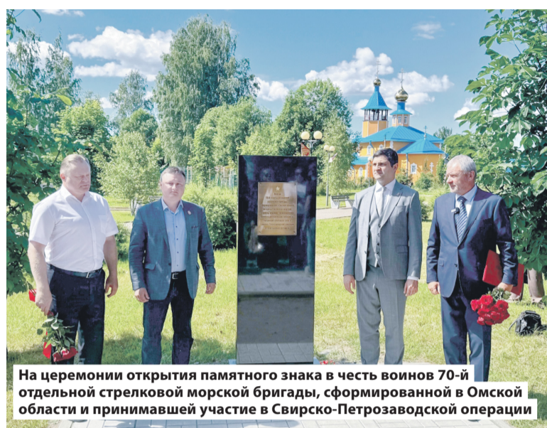
На церемонии открытия памятного знака в честь воинов 70-й отдельной стрелковой морской бригады, сформированной в Омской области и принимавшей участие в Свирско-Петрозаводской операции