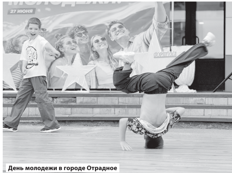
День молодежи в городе Отрадное

На главной сцене города весь день выступали коллективы художественной самодеятельности КСК «Невский», заряжая всех участников и гостей мероприятия отличным настроением. Для самых активных работали спортивные секции, где можно было испытать свою ловкость и скорость, соревноваться в различных дисциплинах: скакалка, отжимания, прыжки в длину и челночный бег. Каждое из этих соревнований стало для участников настоящим испытанием, подарившим