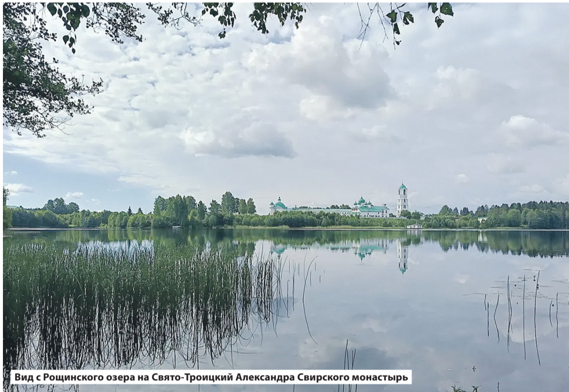
Вид с Рошинского озера на Свято-Троицкий Александра Свирского монастырь

Единым маршрутом по историческим и промышленным объектам