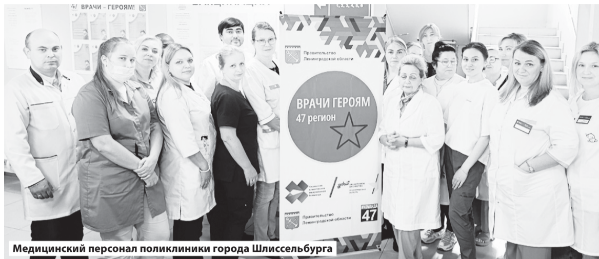
Медицинский персонал поликлиники города Шлиссельбурга

Индивидуальное медицинское сопровождение участников СВО и членов их семей