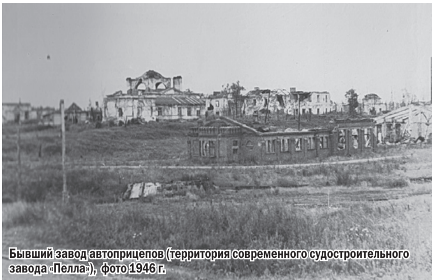
Бывший завод автоприцепов (территория современного судостроительного завода «Пелла»), фото 1946 г.

Чтобы избежать окружения в районе мгинско-синявинского выступа немецкие части 26-го армейского корпуса в ночь на 21 января, оставив заслоны и минировав пути отхода, начали организованный отход на промежуточный оборонительный рубеж по линии железной дороги и шоссе Ленинград — Москва (линия «Автострада»). Обнаружив отход противника, части 67-й армии Ленинградского фронта и 8-й армии