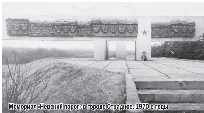
Мемориал «Невский порог» в городе Отрадное. 1970-е годы