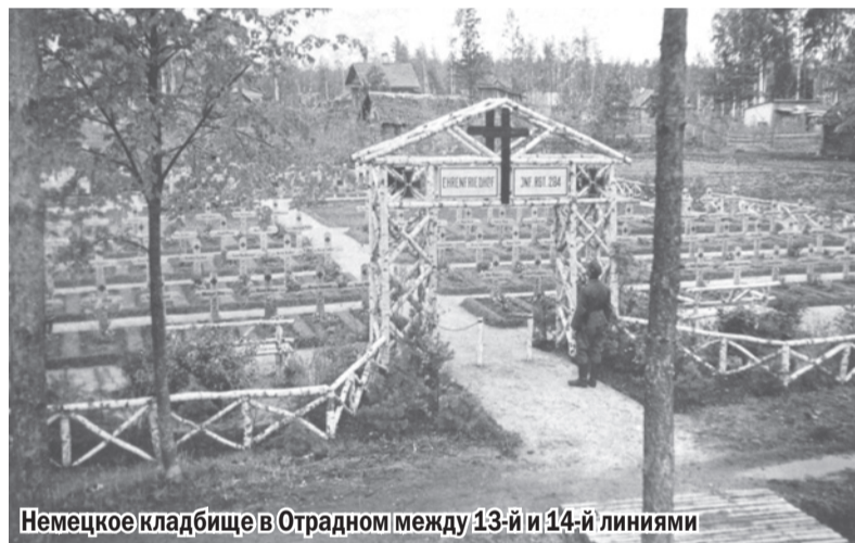
Немецкое кладбище в Отрадном между 13-й и 14-й линиями