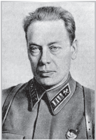
Б. В. Бычевский, полковник, с 4 августа 1942 года — генерал-майор (бывший начальник инженерных войск Ленинградского фронта)

Продолжение. Начало в №29(503) от 27 июля 2017 г., 30(504) от 3 августа 2017 г., 31(505) от 10 августа 2017 г., 32(506) от 17 августа 2017 г., 33(507) от 24 августа 2017 г.