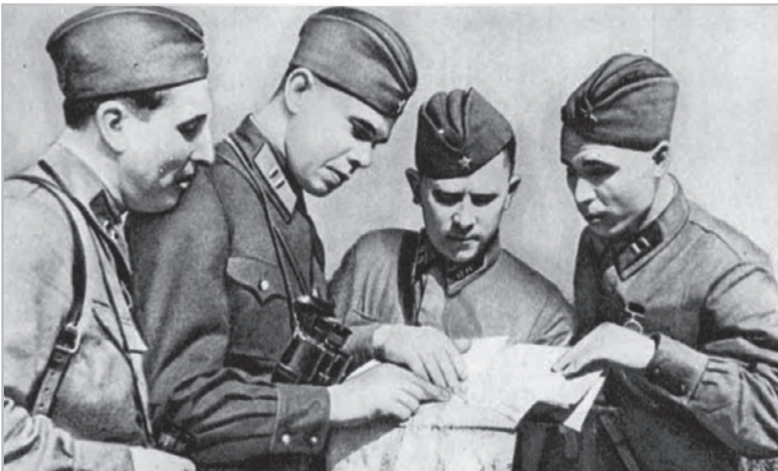
Участники боев за Ивановский плацдарм в 1942 году.

■ Публикация подготовлена по материалам книги «Ивановский порог. Хронология подвига. (30 августа 1941 г. — 22 января 1944 г.)», автор-составитель Ю.И. Егоров, 2015 г.