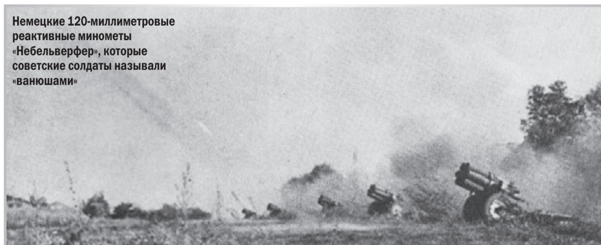
Немецкие 120-миллиметровые реактивные минометы «Небельверфер», которые советские солдаты называли «ванюшами»

■ Публикация подготовлена по материалам книги «Ивановский порог. Хронология подвига. (30 августа 1941 г. — 22 января 1944 г.)», автор-составитель Ю.И. Егоров, 2015 г.