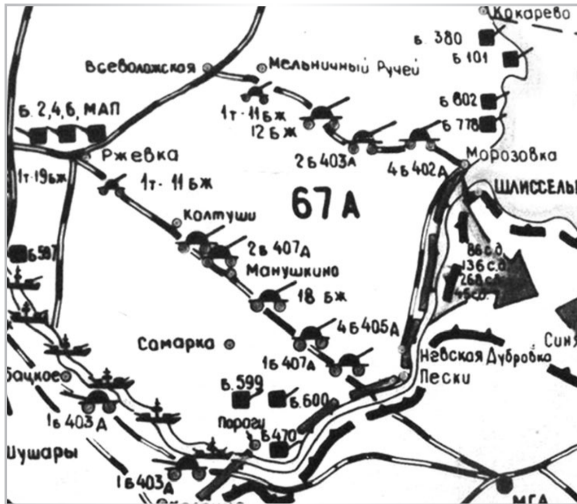
Схема размещения артиллерийских частей КБФ в январе 1943 года. Фрагмент. Значком Б470 обозначена батарея №470

Пытаясь помешать проводимым работам, противник методично подвергал боевые порядки наших частей интенсивному артминометному и ружейно-пулеметному обстрелу. Стремясь воспрепятствовать сообщению с нашими частями, находящимися на восточном берегу реки Тосны, противник особое внимание уделял району шоссейного моста и лодочной переправы, где активизировал деятельность своих снайперов.