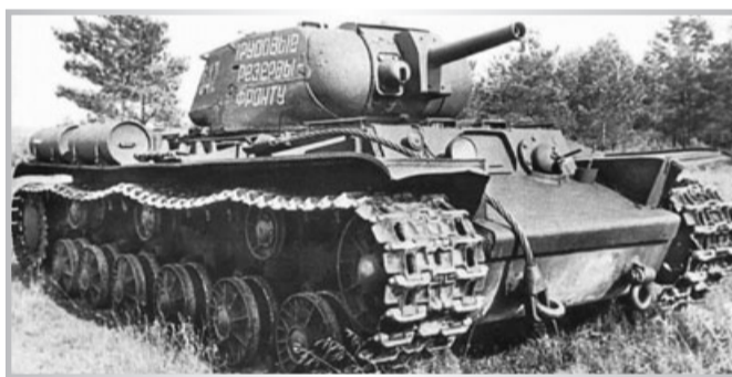
Огнеметный танк КВ-8

обстреливал батарею №470 (район Ивановских порогов); поврежденной материальной части не было. Артиллерийским и минометным огнем был также обстрелян наш наблюдательный пост на правом берегу реки Невы в районе Ивановских порогов. В результате обстрела