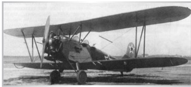
Ночной легкий бомбардировщик У-2

автоматов — 75, противотанковых ружей — 19, ручных пулеметов 49, станковых пулеметов — 23, минометов — 22, револьверов — 2, а также трофейных винтовок — 67, автоматов 15, ручных пулеметов — 19, станковых пулеметов — 2, минометов — 3, пистолетов — 2.