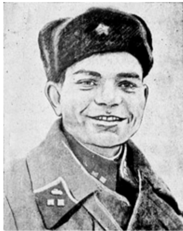
Фомин Федор Фролович, лейтенант, Герой Советского Союза

Продолжение. Начало в №6(480) от 16 февраля 2017 г., №8 (483) от 2 марта 2017 г., №9 (484) от 9 марта 2017 г., №10 (485) от 16 марта 2017 г., №11 (486) от 23 марта 2017 г., №12 (487) от 30 марта 2017 г., №13 (488) от 6 апреля 2017 г., №14 (488) от 13 апреля 2017 г.