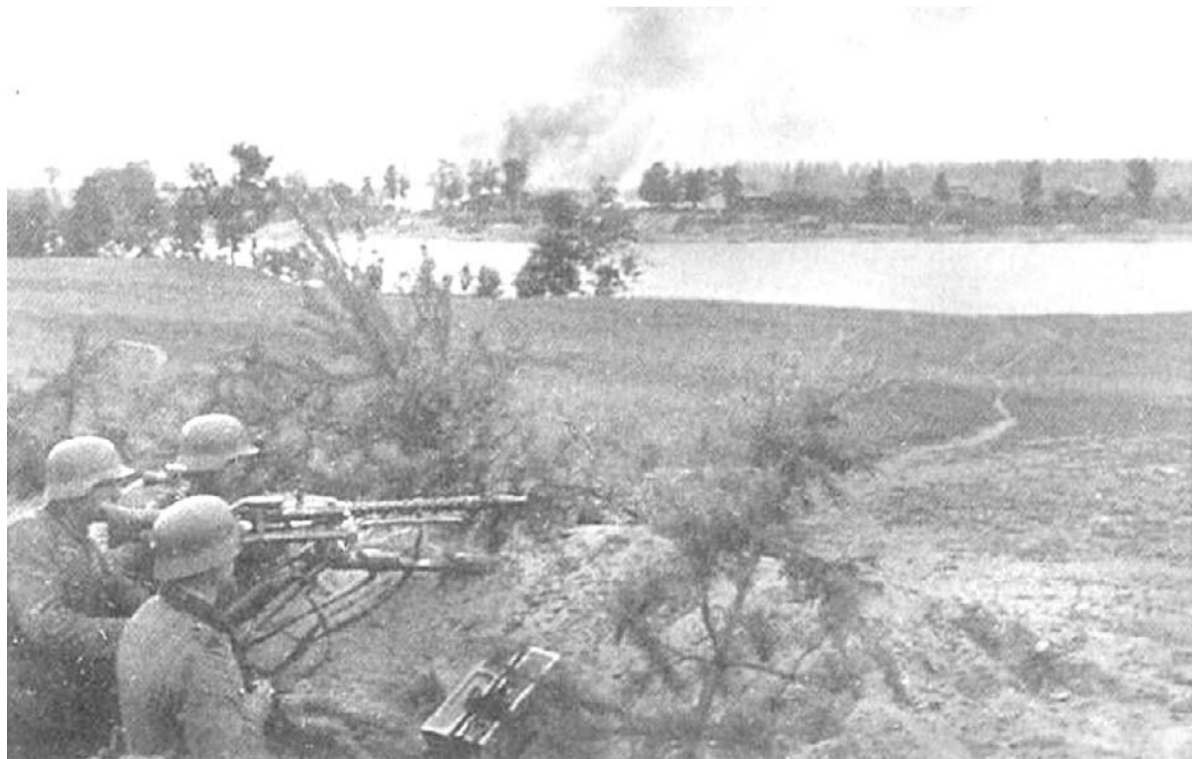
Пулеметчики немецкой 20-й моторизованной дивизии у Петрушино на Неве. Сентябрь 1941 г.

■ Публикация подготовлена по материалам книги «Ивановский порог. Хронология подвига. (30 августа 1941 г. — 22 января 1944 г.)», автор-составитель Ю.И. Егоров, 2015 г.